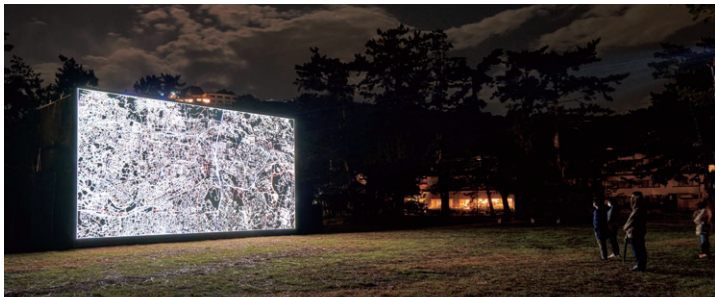
© 2020 Ryoji Ikeda Studio / ALTERNATIVE KYOTO 2020 Artspace of the Light

Organizer: Bold Admission: Free by presenting your ACK ticket